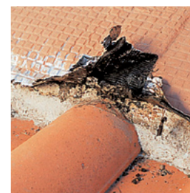
Dégât: Décollement et fissuration de l'étanchéité